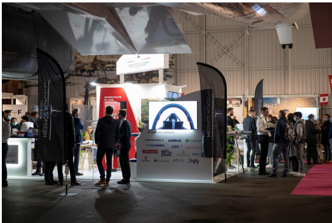
30e édition du Salon des Formations et Métiers Aéronautiques

construction, de l'ingénierie ou de la recherche pour la transition écologique du secteur. Le salon offre ainsi l'occasion de rencontrer des recruteurs pour un contrat, un stage, une alternance... et de nouer de précieux contacts.