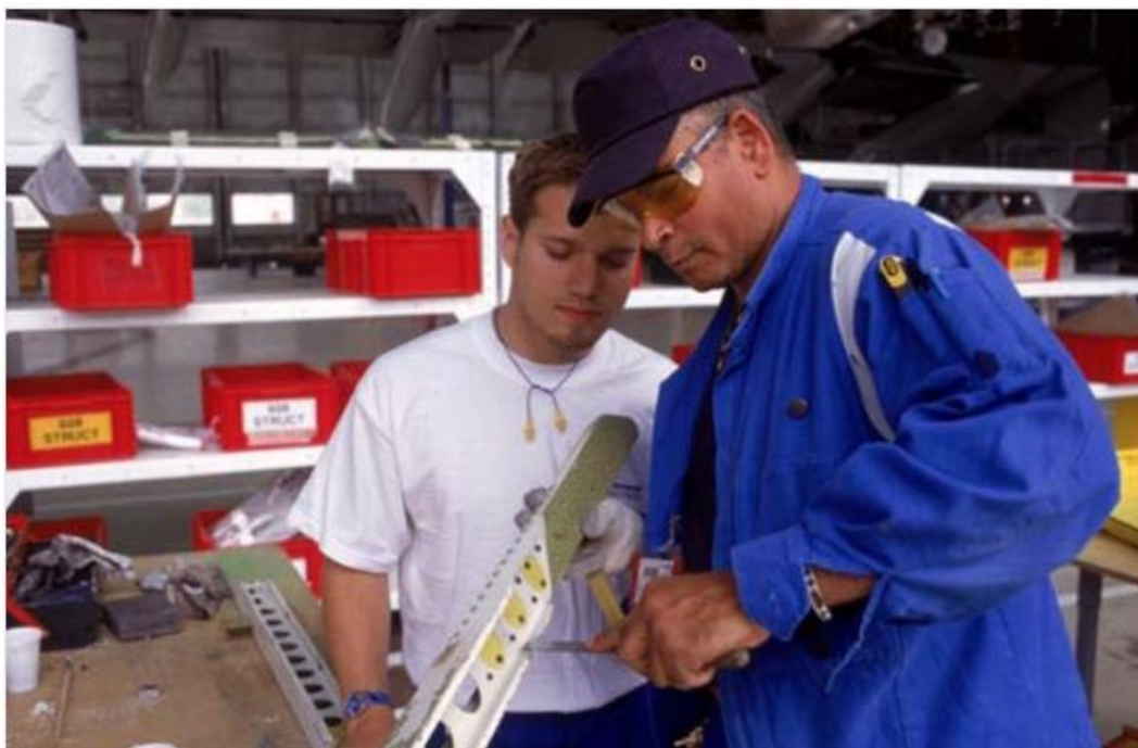
La formation se structure pour faire face aux besoins croissants de l'industrie aéronautique.

La 25 e édition du Salon des Formations et Métiers aéronautiques se tiendra au musée de l'air et de l'espace du Bourget. A cette occasion, le magazine Aviation et Pilote, organisateur de l'événement, sort un numéro spécial « Guide des métiers » de 116 pages.