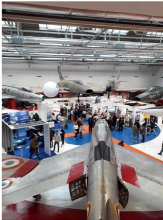
Hall de la Cocarde du musée de l'Air et de l'Espace

Nous étions cette année de nouveaux partenaires et chargés des relations presse du Salon des Formations et Métiers aéronautiques. Cette 26 e édition a été un succès sur tous les plans : organisation, fréquentation et couverture médiatique.